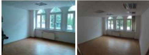
Raum2 (1. Tür rechts)