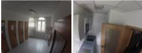
Küche + Toilette