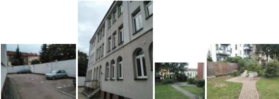
Parkplätze, Rückseite und Garten