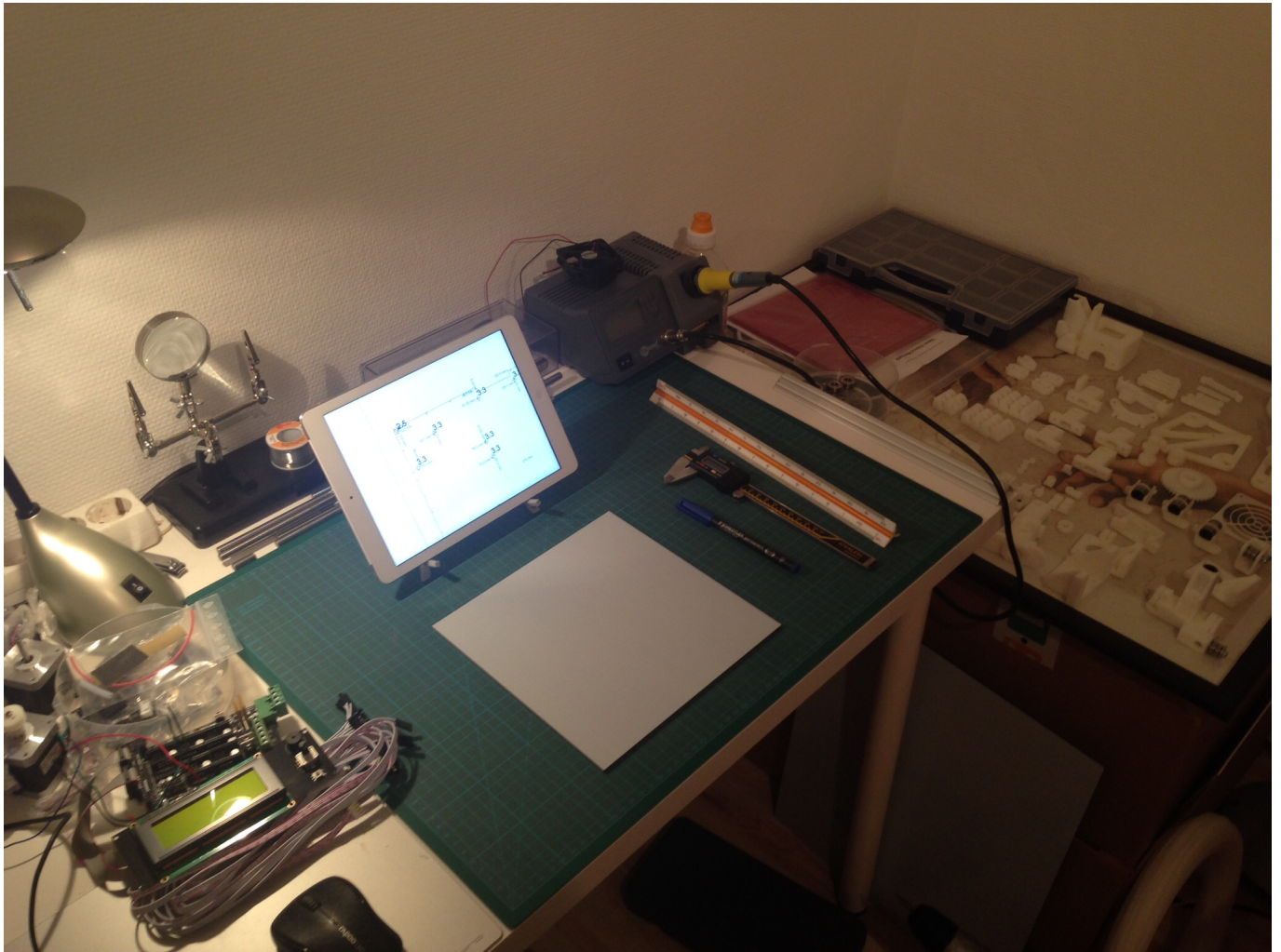
Die Bohrschablone neu berechnet.