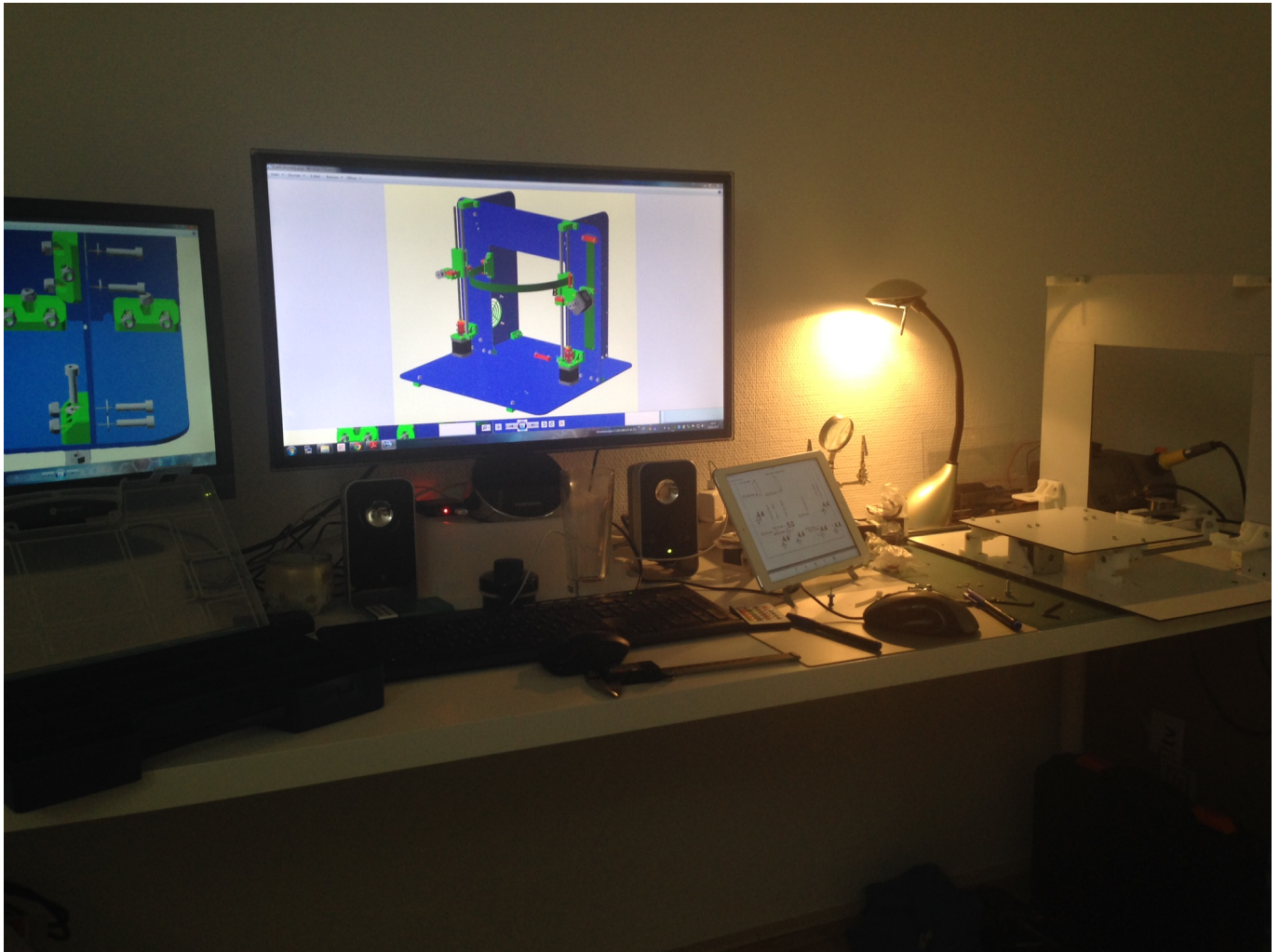
Zum besseren Verständnis 3D Zeichnung benutzt.