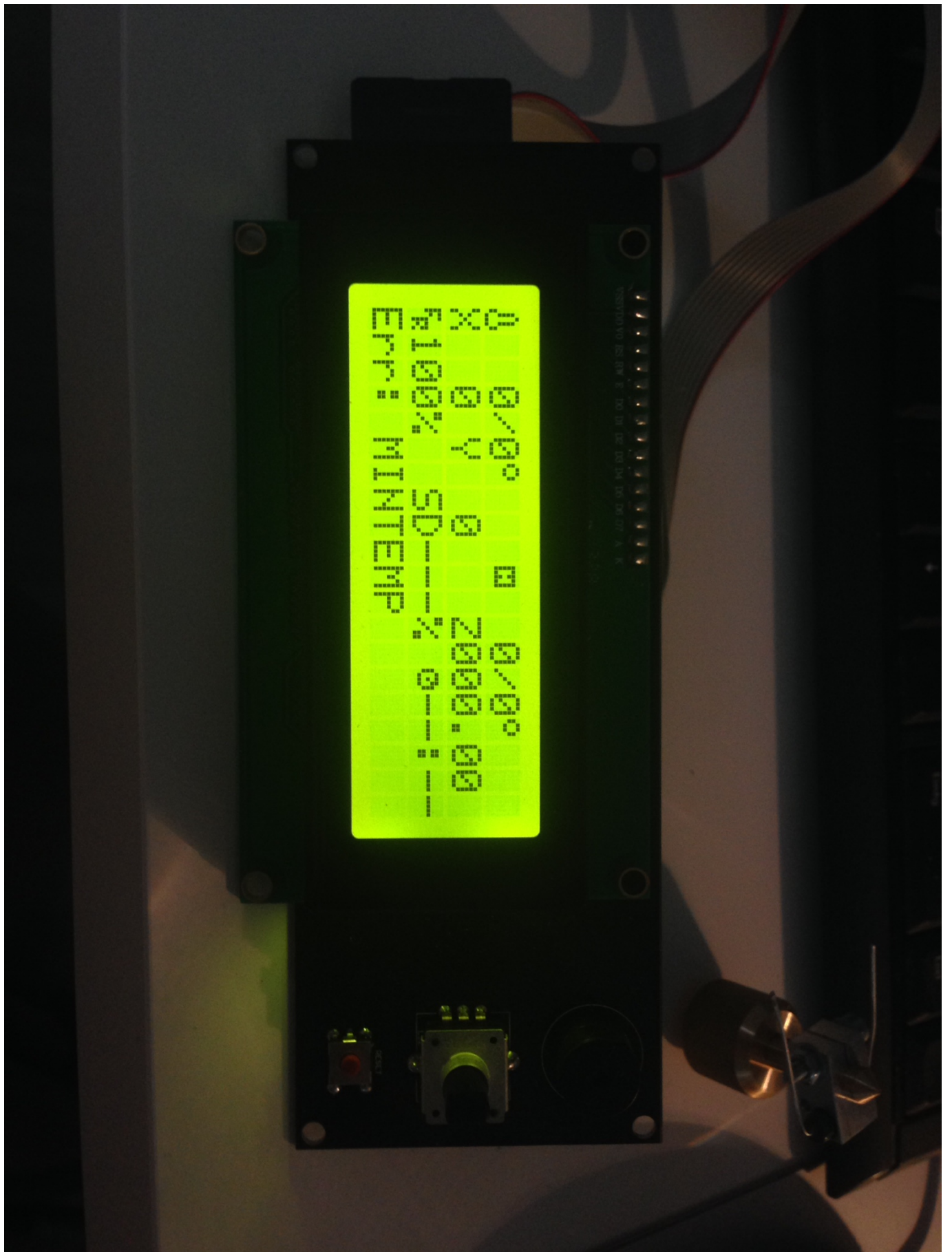
Firmware im ersten Versuch.