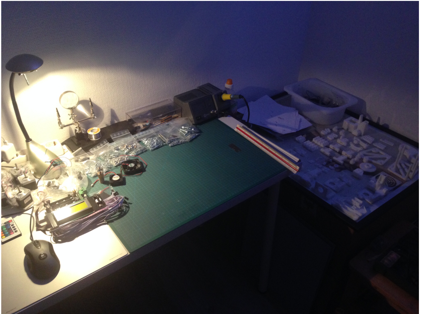
Vor Beginn, alle Teile sind zurecht gelegt.