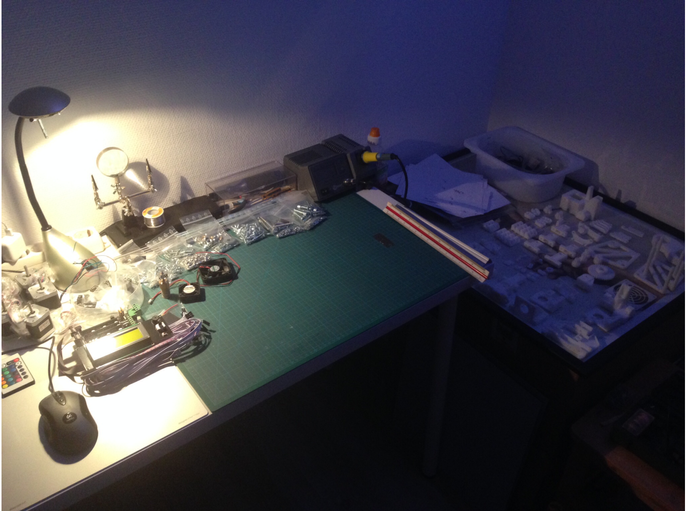
Vor Beginn, alle Teile sind zurecht gelegt.