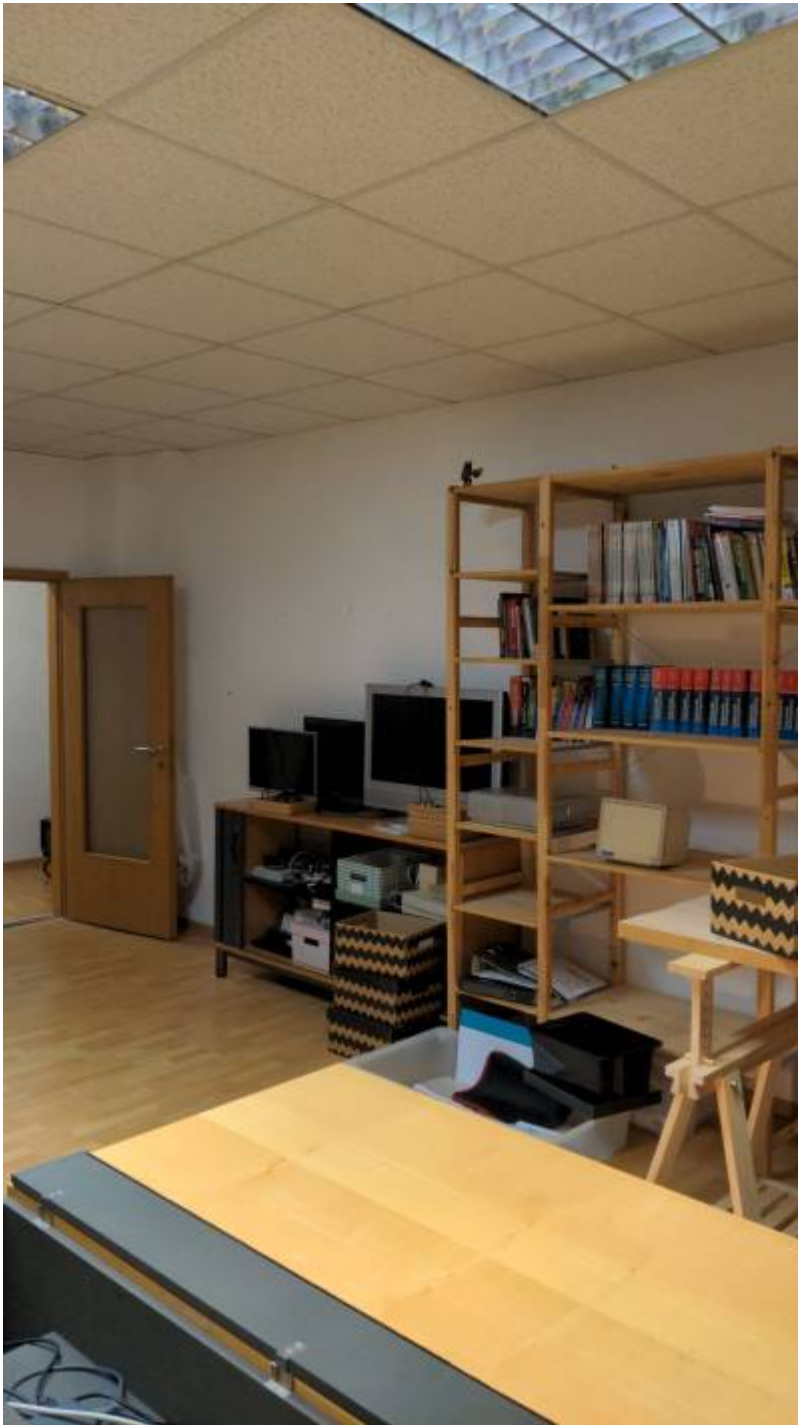
Neuer Konferenzraum, bestehendes Regalsystem