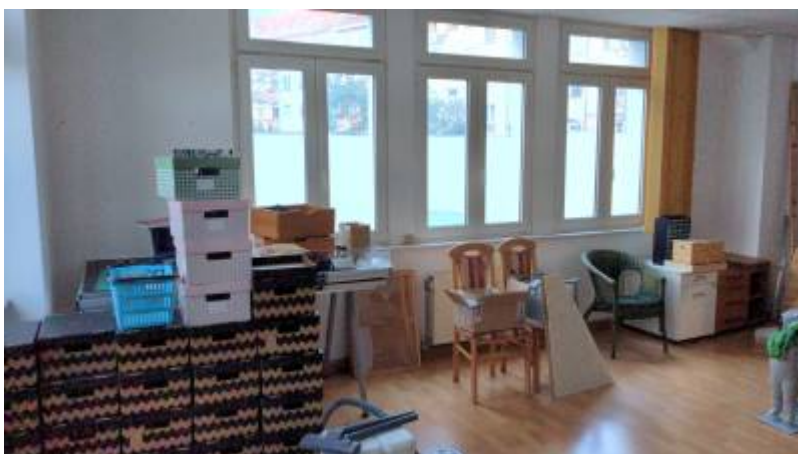
Zweiter Hackspace-Raum, noch nicht leergeräumt