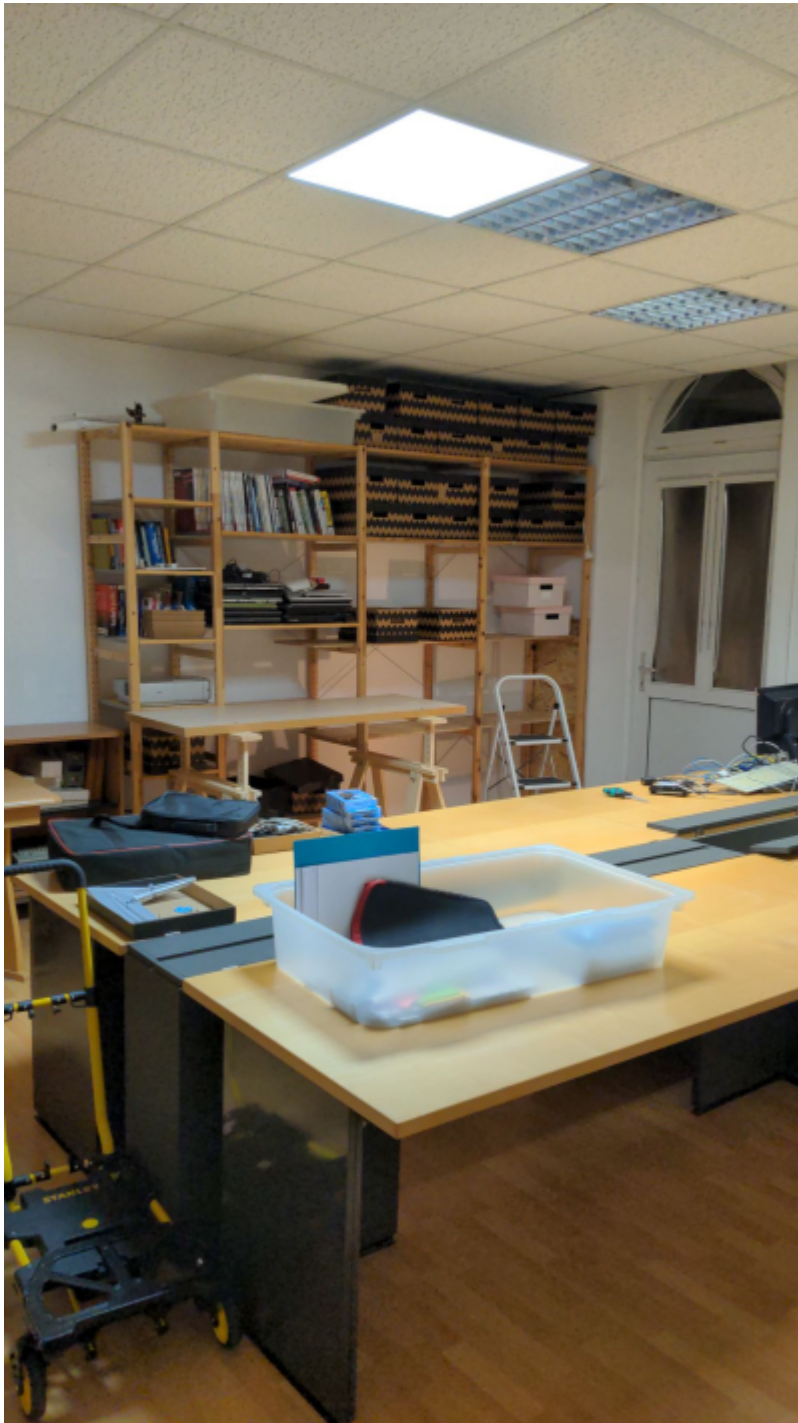
Neuer Konferenzraum fast fertig eingerichtet