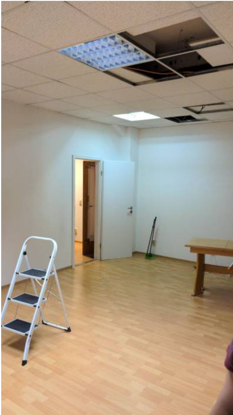
Neuer Konferenzraum, Blick zum Flur