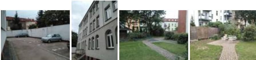
Parkplätze, Rückseite und Garten