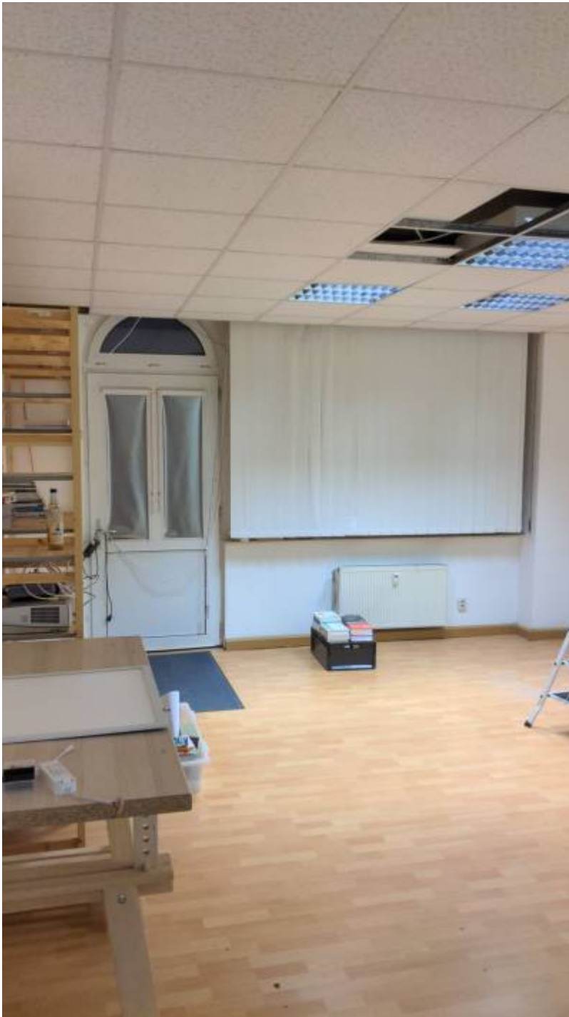
Neuer Konferenzraum, Blick zum Hintereingang