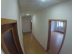
Raum 1 (2. Tür rechts)